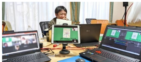
▲ポケサポデーでのオンライン交流の様子