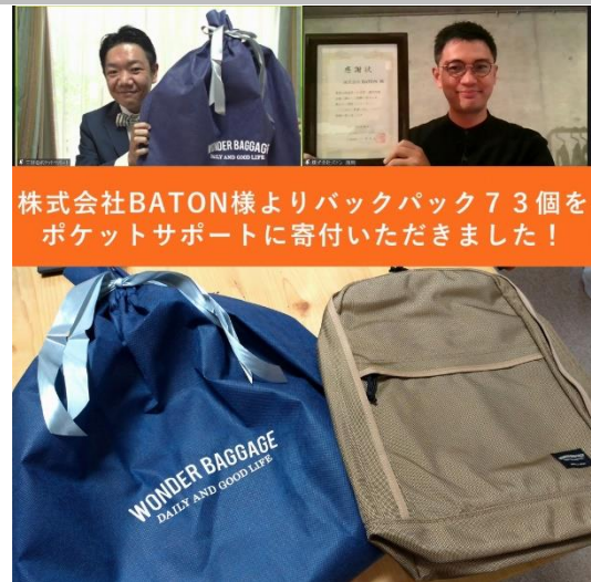
株式会社BATON様よりバックパック73個をポケットサポートに寄付いただきました！

株式会社 BATON 様よりバックパックを 73 個寄贈いただき、ポケットサポートの利用者、県内支援学校の病弱部、放課後等デイサービスを利用する子どもたちやきょうだいへ配布した。