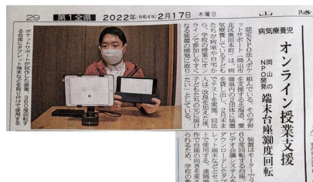
▲2022年2月17日(木)山陽新聞朝刊掲載