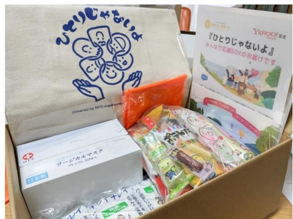
▲みんなで応援BOXの内容物

また、当団体と繋がるきっかけを増やすことを目的とし、当事者が検索する想定キーワードから、検索連動型広告を掲載し特設ページを制作した。相談事例の紹介、保護者からの声、多職種連携での支援内容、相談窓口などを情報提供した。