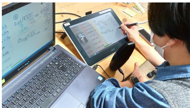
▲支援拠点での個別学習支援風景