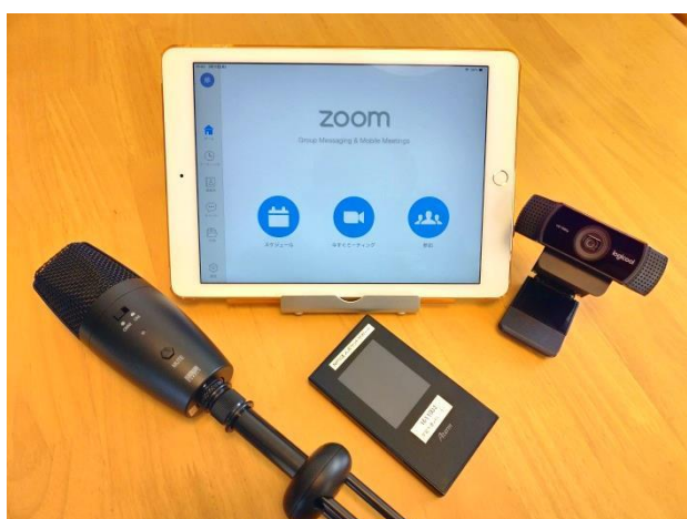
▲双方向WEB学習支援用ICT機器