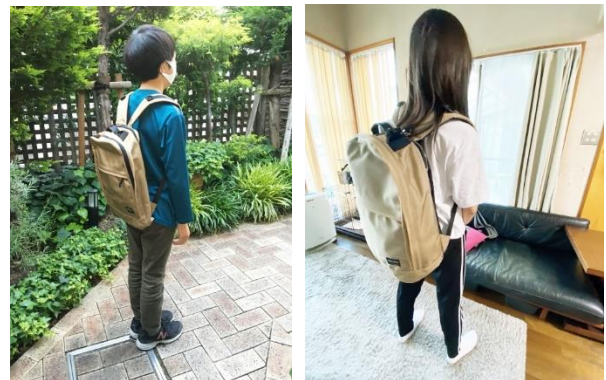
▲子どもたちから届いた着用写真