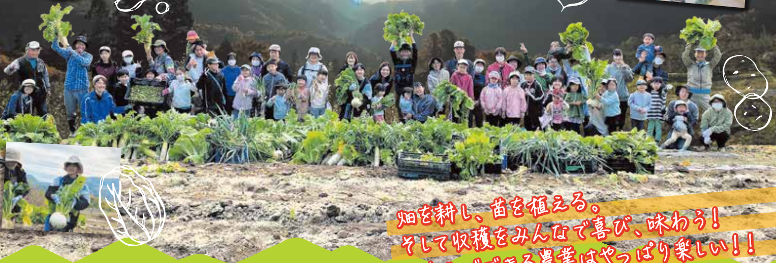
※写真は2023年度の活動です。

畑を耕し、苗を植える。 そして収穫をみんなで喜び、味わおう! みんなでできる農業はやっぱり楽しい!!