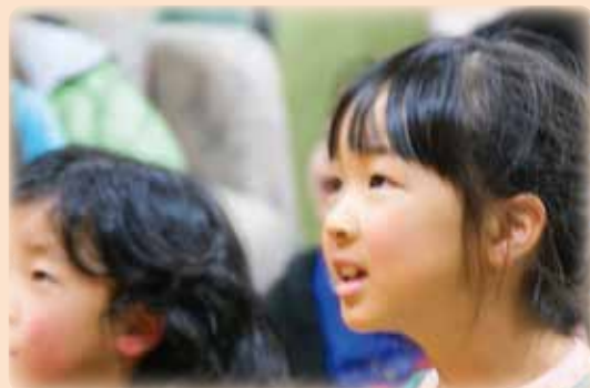
直方文化のつどい