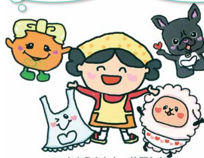
ささえさんと 仲間たち