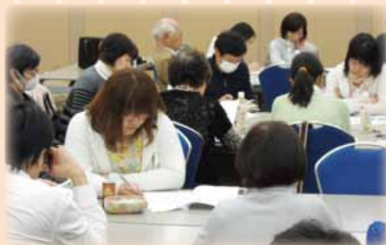
ケアワーカー集会