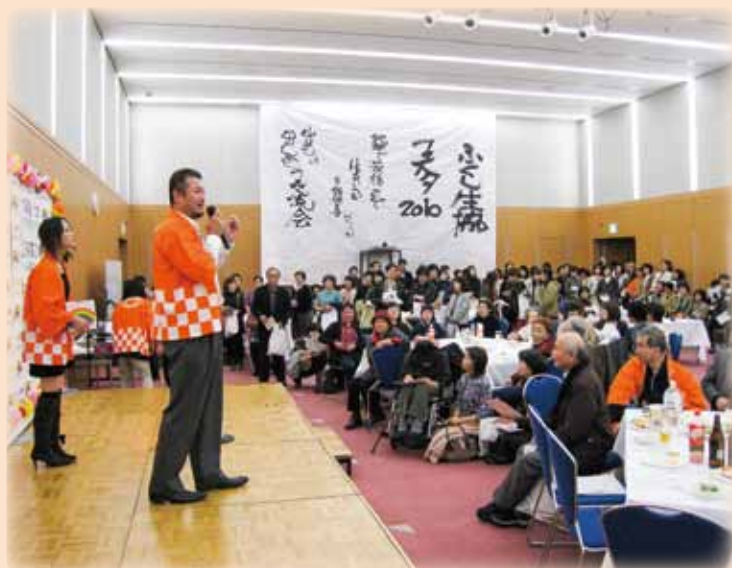
ふくし生協フェスタ