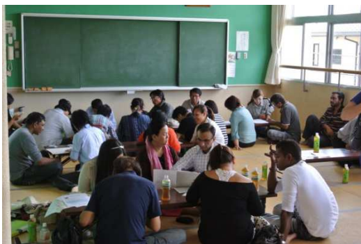
2014 年太田会場 問診票

2月3日 火 クルド人 2月4日 水 太田事務所 2月9日 月 太田事務局 2月10日 火 済生会前橋 2月11日 水 宇都宮田中先生講演会 2月17日 木 済生会鴻巣病院 2月18日 水 自治医大大宮病院 2月19日 木 事務局 2月25日 水 弁護士会 2月26日 木 事務局会議 2月27日 金 あうん訪問 2月28日 土 家庭訪問2ヶ所及び協立診療所