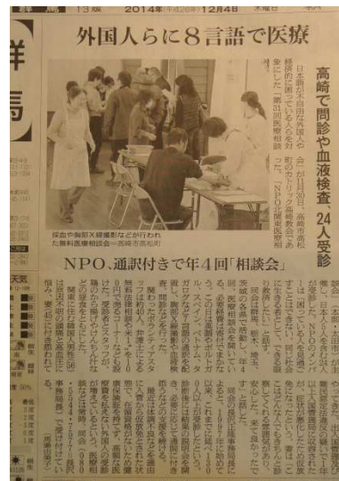
高崎会場 朝日新聞記事