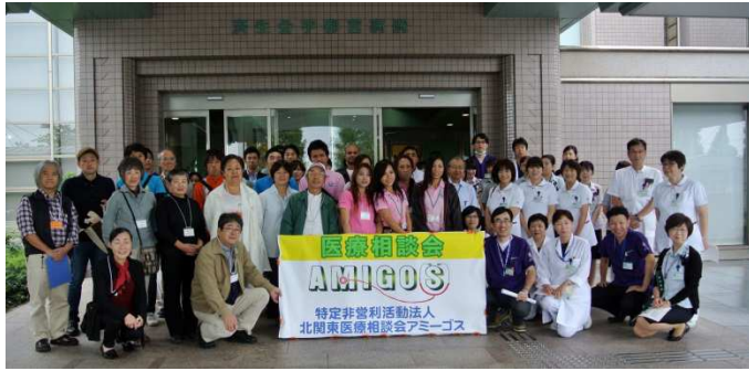
2014年10月5日 宇都宮済生会会場