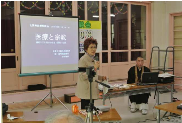
2015年2月11日講演会 カトリック松が峰教会