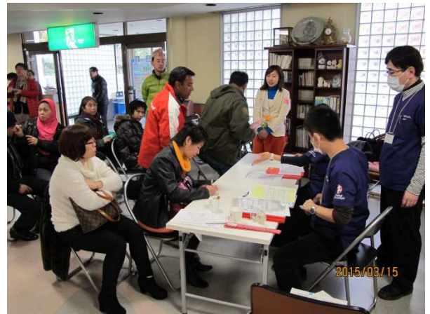
2015年3月15日栃木県益子会場