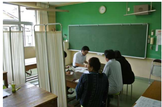
2014 年 太田会場 弁護士無料相談会