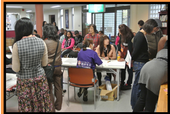
普門院診療所会場