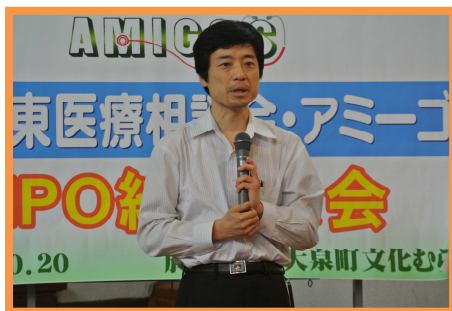
10月5日沢田先生講演