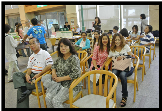
済生会宇都宮会場