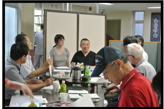
普門院診療所打ち合わせ