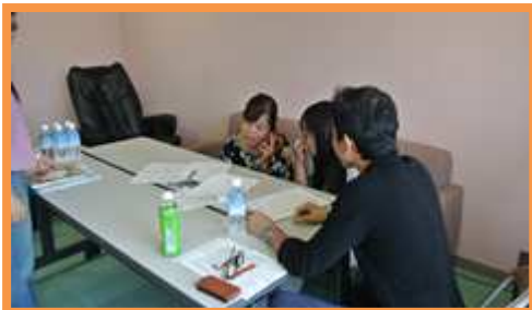
済生会宇都宮病院にて

この法人は、すべての人が健康と平和な生活ができる共生社会の実現をめざし、特に外国籍・生活困窮者のための保健、医療又は福祉の増進を図る活動、社会教育の増進、災害救護、人権の擁護、国際協力などの活動を目的とする。