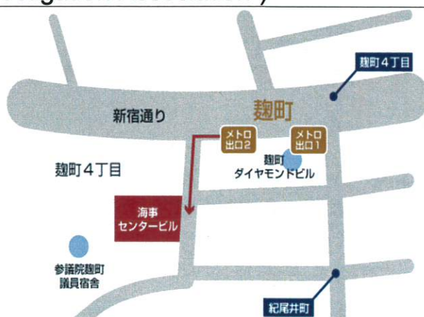
地下鉄有楽町線 麹町駅 [2番出口]より徒歩3分

☎ 03 - 3512 - 8140 ファックス 03 - 3512 - 8142 携 帯 090 - 6036 - 9433 〒102-0083 東京都千代田区麹町 4-5 海事センタービル 5階 e-mail kaisin-f@maia.or.jp ホームページ http://www.maia.or.jp/