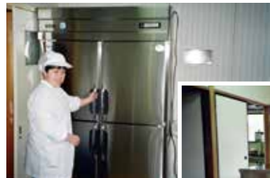
▲平成7年 第2作業棟改装