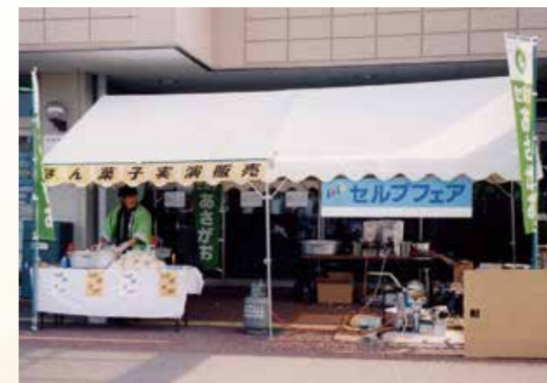
▲平成13年 ポン菓子実演販売 あさがお