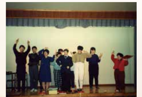
▲平成4年 かんしゃかい