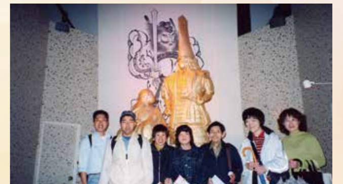
▲平成14年 加賀百万石博にて 松の実