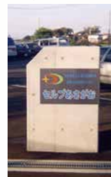
▼平成●年 看板設置 あさがお