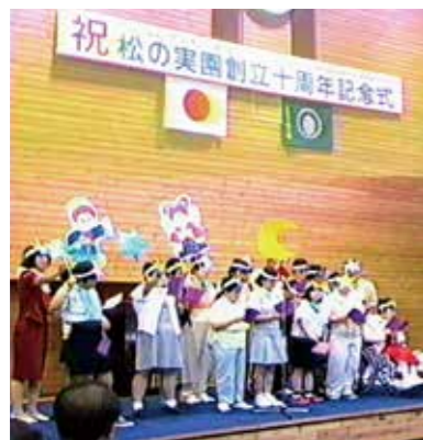
▲平成8年 十周年記念式典