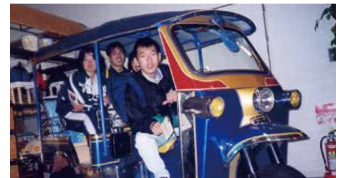
▲平成12年 自治会行事の遠足 あさがお