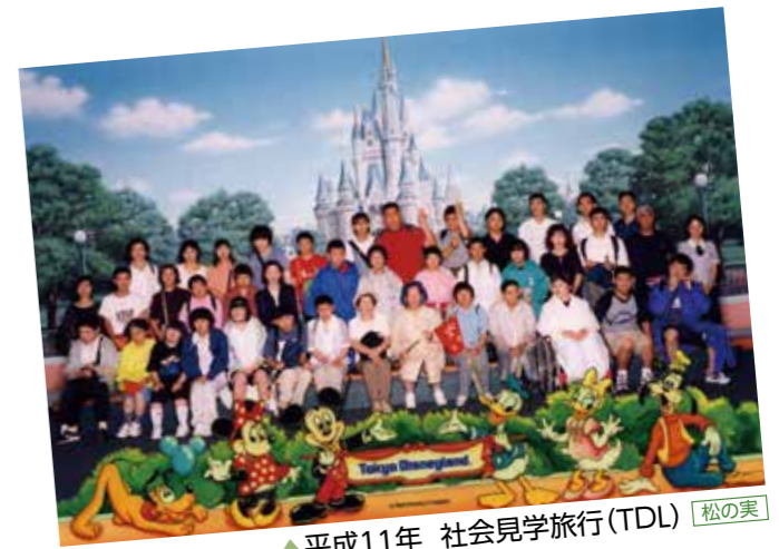
▲平成11年 社会見学旅行(TDL) 松の実