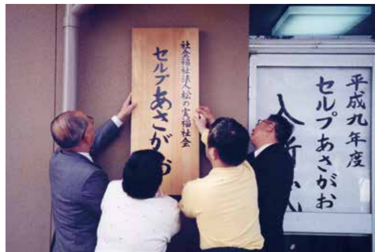
平成9年 セルフあさがお開所▶