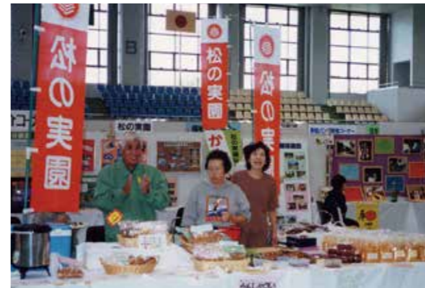
▲平成12年 販売活動 松の実