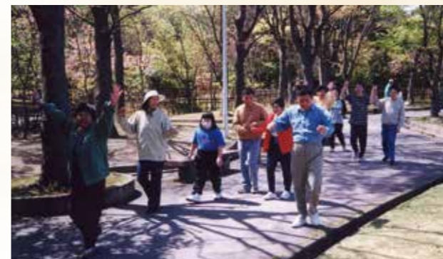
▲平成14年 体力作り 松の実