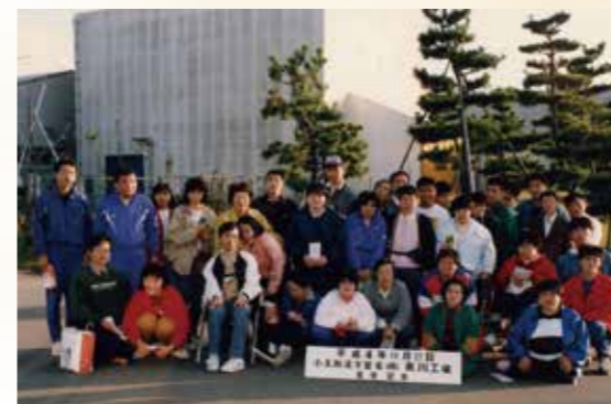
▲平成4年 事業所見学