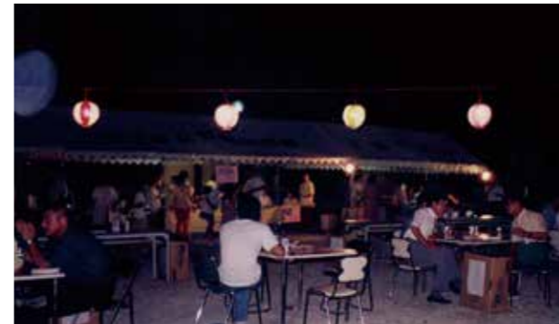
▲平成11年 きらきらまつり あさがお