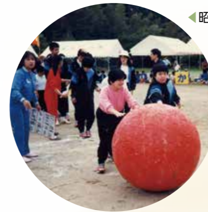
◀昭和63年 施設合同運動会