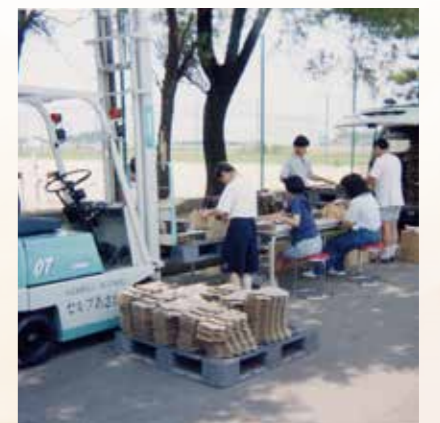
▲平成13年 作業活動 あさがお