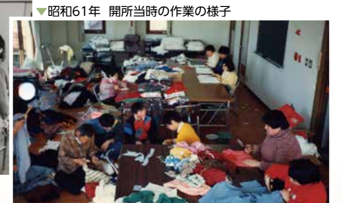
▼昭和61年 開所当時の作業の様子