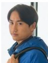
安江省吾 エシカルアクション代表