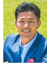
廣瀬俊郎 元ラグビー日本代表