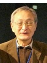
兼廣春之 東京海洋大学名誉教授