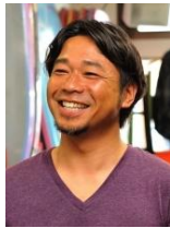
平林政夫 プロボディボーダー