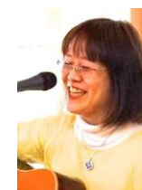
さとさとみ 歌う整体師