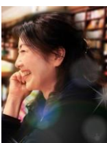
加藤美幸 シンガー/アーティスト