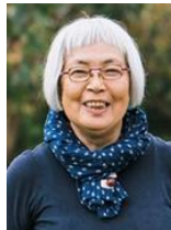
中園五月 精進料理 iori