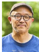
寒川ー アウトドアアドバイザー