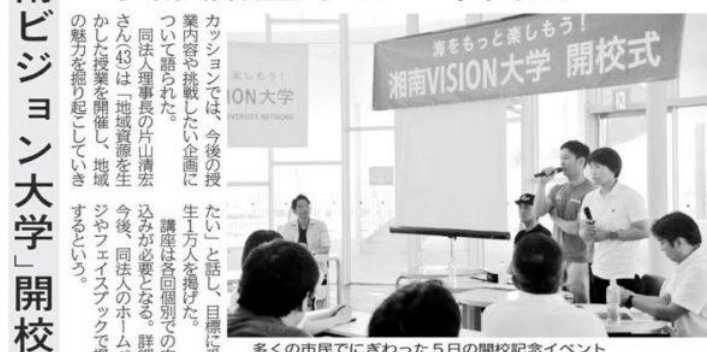
多くの市民でにぎわった5日の開校記念イベント —藤沢市江の島