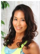
ノリ ヨガインストラクター