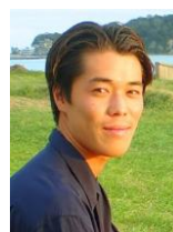
堀越 力 プロサーファー