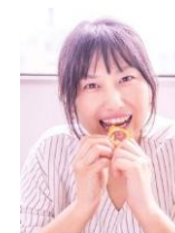
KAYO 消しゴムはんこ講師