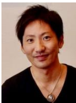
LYDS KAZ フォトグラファー