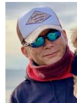
草薨徹 江ノ島イルカ部