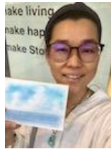
こまゆき くじらパステル