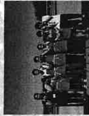
おにぎり・カレー販売してます