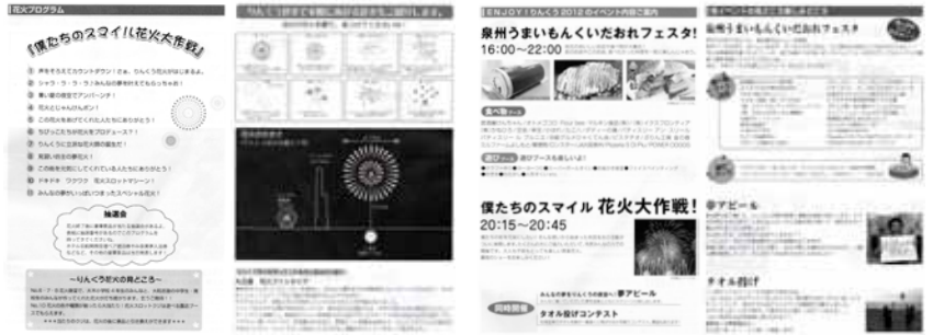
必見！花火プログラム+解説