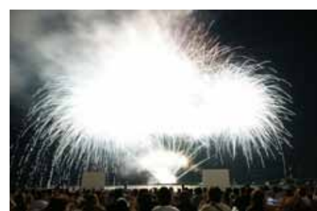
ラストはキラキラ花火に涙しました