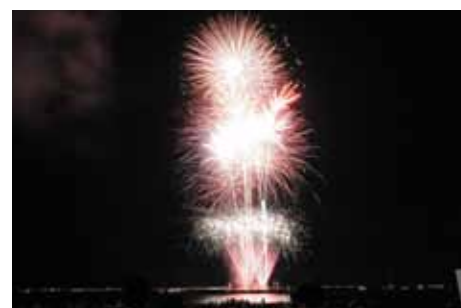
どんどん派手になって♪