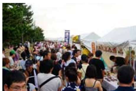
雨あがって、こんなに賑わいました