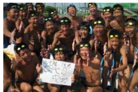
友情・夏の思い出・夢アピール