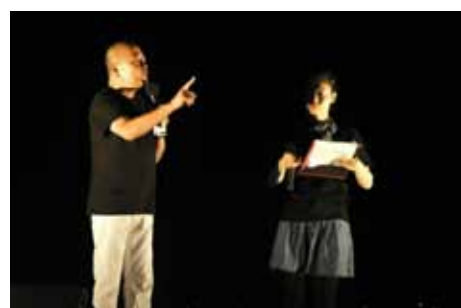
いざ登場! 我らが「ヤマヒロ」ア+