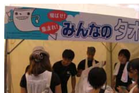
タオルって投げたらどこまで飛ぶの?