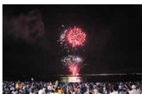
さあ、いよいよ花火スタート!