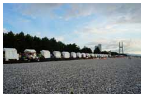
ずらいと並ぶ「くだおれ」