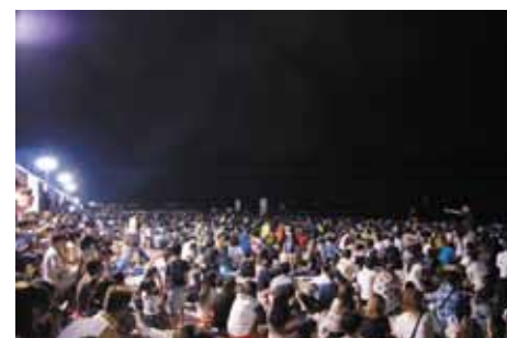
会場ぎっしり 25000 人のみんな