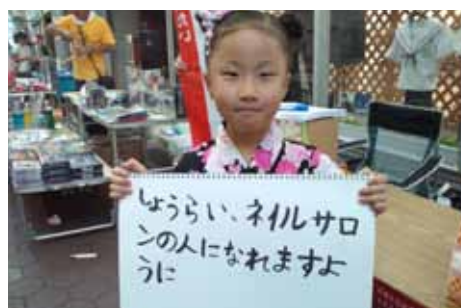
いつかきっと夢が叶いますように