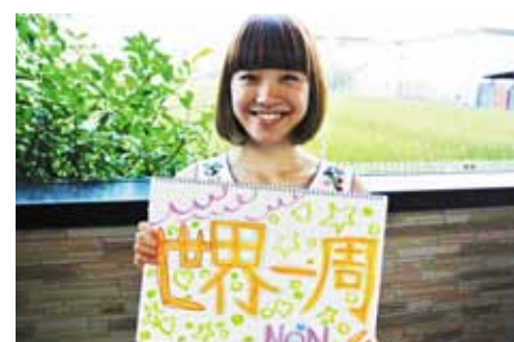
閑空から飛び立って!