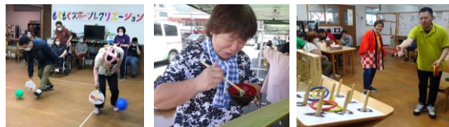
【スポーツレク】 【そうめん流し】 【夏祭り】

昨年は新型コロナウイルスの感染拡大防止のため外出行事は行わず、手洗いや消毒、マスクなど感染予防をしっかり行いながら、もくもくの中で出来る行事として、スポーツレクリエーションや昼食会、そうめん流し、夏祭りなどを行いみんなで楽しみました。