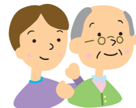
[肩たたき・マッサージ]