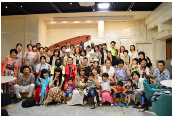
2015 年 8 月啓発イベントの様子