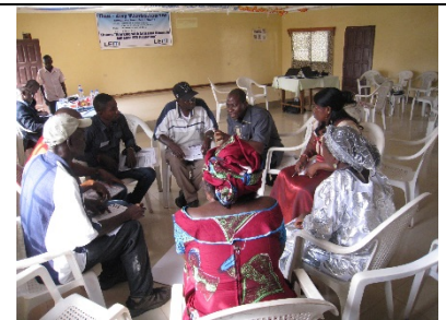
ワークショップでの意見交換の様子

LEITI が地方都市 2 箇所で開催した、鉱物資源採掘労働者の組合化への第一歩となるワークショップに、現地コーディネーターがオブザーバーとして参加。ワークショップでは、MLME 副大臣が組合化の意向をスピーチし、CDA 職員が労働組合のコンセプトを発表し、参加した鉱物資源採掘労働者代表達による意見交換が行われた。