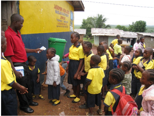
の学校で手洗いを行う生徒 行っている様子