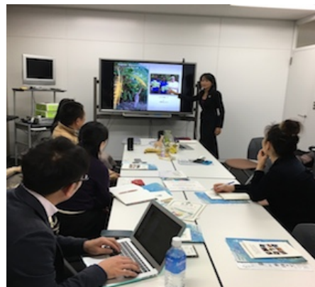
2016 年 1 月の勉強会の様子

アンゴラのダイヤモンド採掘地域で行われた拷問 500 件、殺人 100 件の証拠を集め、書籍『ブラッド・ダイヤモンド』で告発し、アンゴラ裁判所から有罪判決を受けたジャーナリストの判決取り消しを求める署名活動、「ジャーナリストへの有罪判決の取り消しを！～アンゴラのダイヤモンドの不都合な真実を暴き有罪判決を受けた、ラファエル・マルケス・デ・モライス氏に対する判決取り下げを求めます～」を実施（日本語及び英語）。2016 年 2 月 28 日までに、25 カ国から 436 筆の署名があり、2016 年 3 月 1 日に在アンゴラ大使館に提出。また、2015 年 6 月には本件に対する当法人の声明を発表した。