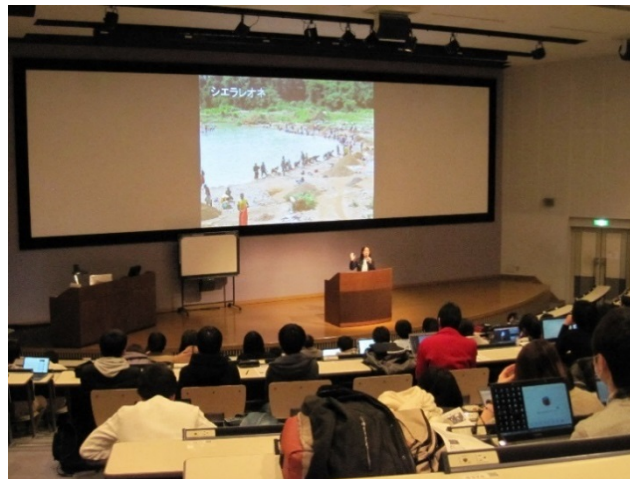
2016年1月 東京工科大学での講演