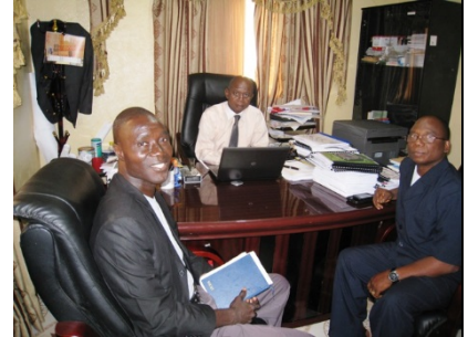
現地コーディネーターと MLME 副大臣の面談の様子