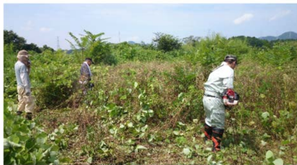
就労体験：除草作業