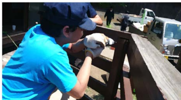
就労体験：空き家清掃（解体）