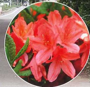
小平市の花 “ソツジ”