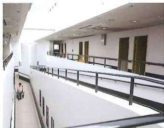
▲吹抜の天井から日差しが降り注ぐ館内