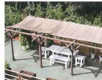
▲花を育てたり、お話ししたり…屋外テラス