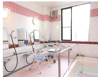
▲入浴は大切な健康法。いつも清潔に…