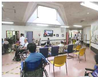
▲明るいフロアーはみんなの憩いの場