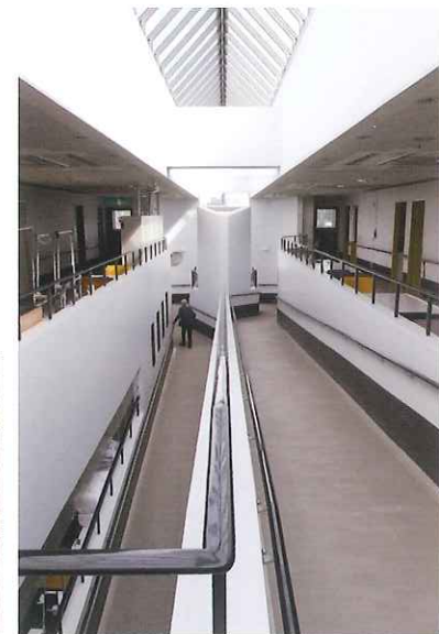
▲日常生活の中でも歩行訓練ができる館内通路