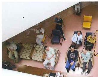
▲2階の吹き抜けからフロアーを望む