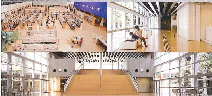
Workshop 「チーム・ズルバ」 大津翔 (2009, YCAM オリジナルワークショップ)

情報社会への関心やリテラシーの普及、拡大を目指し、「メディア」「社会」「身体」をキーワードにしたオリジナルワークショップを開発し、実施しています。さらに、より有意義に作品を楽しむ機会として、ギャラリートツアーをはじめとする様々な教育普及事業を展開しています。また、同時代の優れたパフォーマンスや、YCAM の音響・映像環境を生かした質の高いサウンドアートを紹介しています。