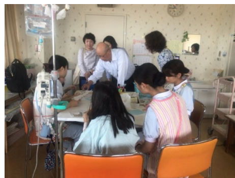
キットの使用感についての視察