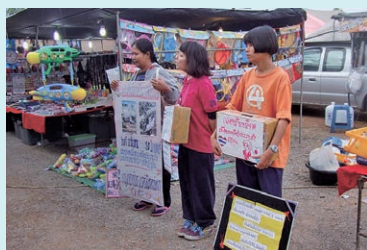
Bangkok YMCA Phayao center, Thailand

中国・上海YMCA、韓国・光州YMCA、台湾・台北YMCA、タイ・バンコクYMCA等、横浜YMCAと交流のある海外YMCAからも多くの募金や物資援助が届きました。