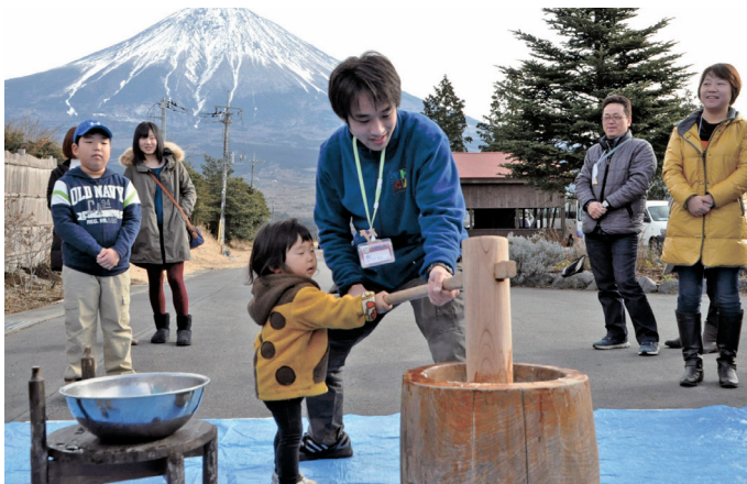
Fujisan YMCA new year family camp

◀ 試合開始前に、避難者の小中学生たちが、各ポジションで選手たちを出迎えました。