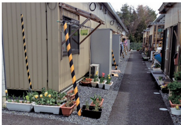
Flower project in cooperation with the company

2012年、2013年に、1000球ずつアテナ株式会社の協賛でチューリップの球根を南三陸町に届けました。写真は戸倉地区の仮設住宅で開花したチューリップ 2014年3月撮影