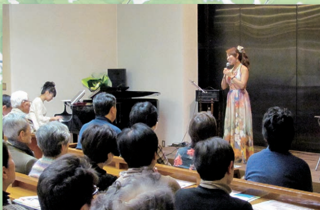
Charity jazz concert at Yokosuka

ジャズボーカルとピアノによる東日本大震災復興支援のためのジョイントコンサートを実施しました。参加者数、ボランティア数150名 <YMCA三浦ふれあいの村、横須賀YMCA共催>