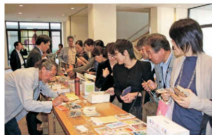
YMCA staff members studied about the earthquake on October 14th YMCA 記念日に、全職員が東日本大震災に関する学びを深めました。(10月14日)