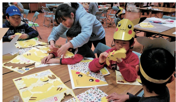
Collaboration with the regional society

守りたい・子ども未来プロジェクトが主催し、毎月おこなわれている福島の方々の交流会では、YMCAも会場提供をしたり、ボランティアとして参加をしたりしています。