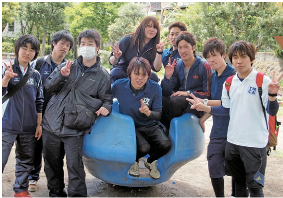
Shonan charity walk by the YMCA college students