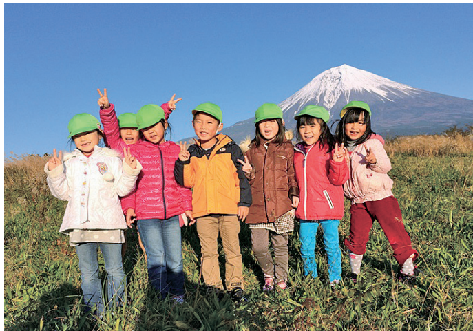
Fujisan YMCA camp with children from Fukushima Iwaki city

原発の事故で、外でおもいきり遊ぶことができない福島の子供たち。横浜YMCAでは、2011年度と2012年度はクレディスイスの協賛で、2013年度は横浜YMCA保育事業の募金活動によって、いわき市の保育園児・幼稚園児を富士山YMCAに招待してきました。底抜けに明るい子どもたちの笑顔がみられました。