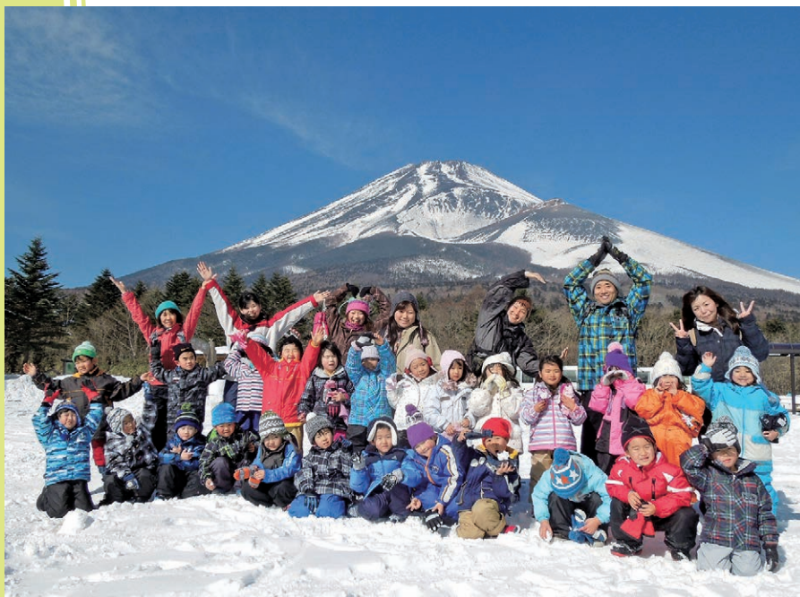
福島県いわき市のわかぎ幼稚園との交流・富士山YMCAキャンプ Exchange between Fukushima Iwaki-Wakagi kindergarten and YMCA nursery in Fujisan YMCA Global Eco Village