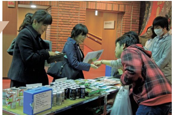
Display of a motion picture about the earth quake

厚木YMCAが、厚木災害ボランティアネットワークと共催してDVD「逃げ遅れる人々」を上映しました。(厚木YMCAでは昨年もDVD「3.11をいきて」を上映しました。) 於：厚木市文化会館