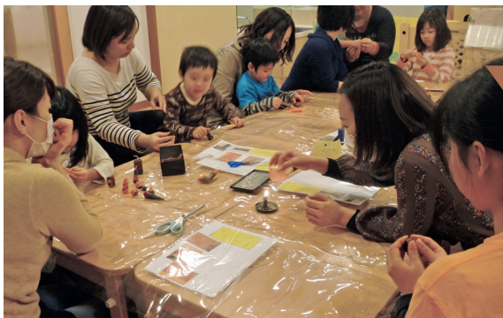
Presentation of the handmade craft from YMCA preschooler to stricken area preschooler