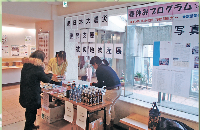
Sale of Iwate products to support Iwate

被災地のことを覚え、支援するための物産展と写真展を開催しました。参加者数、ボランティア数150名 <横浜北YMCA>