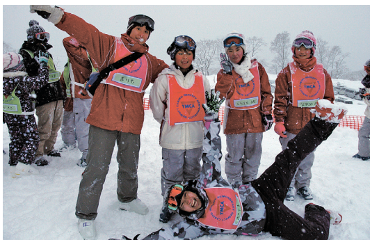
Volunteer of the Morioka YMCA ski camp

2012年から2013年で、盛岡YMCA宮古ボランティアセンターが主催する被災者支援キャンプに9名のキャンプボランティアを派遣しました。その他、多くの会員、スタッフが宮古ボランティアセンターへの活動を継続しています。