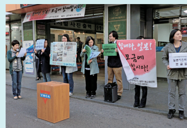
Kwangju YMCA, Korea

We also received substantial contributions from Shanghai and Taipei YMCAs.