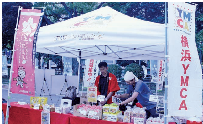
Fukushima specially shop stall in Yokohama baseball stadium

横浜スタジアムで行われた東日本大震災復興応援ゲームで出店された「福島県アンテナショップ」