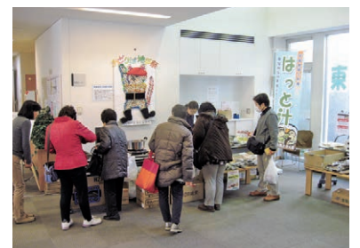
3月7日から8日に実施された踊場地区センターでの被災地物産展