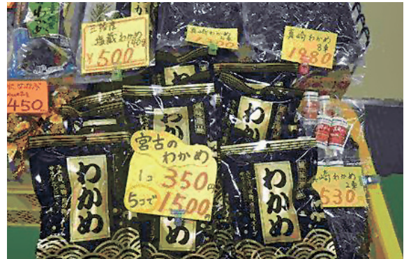
Sale of Miyako products to support Miyako

横浜YMCAでは、様々なイベントと連動して、宮古の物産展・物販協力を継続しています。