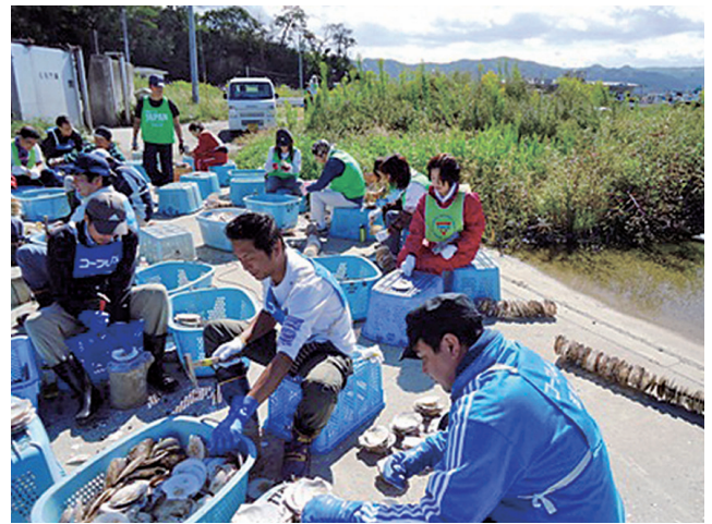
Volunteers of Miyagi Sodehama

2012年から2013年、仙台YMCAを通して袖浜漁協から牡蠣の養殖に関わるボランティア派遣依頼がありました。横浜YMCAから会員、学生、講師、スタッフはもちろん、一般参加も合わせて38名のボランティアを派遣しました。それ以外にも韓国光州から6名のメンバーがこのボランティアに参加しました。今後も要請があれば、牡蠣の殻むきや養殖のためのいかに作りなどのボランティアを呼びかけていきます。