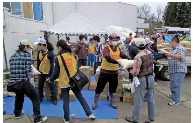
Volunteers of Minamisanriku, Miyagi

2011年3月11日の震災以後、整地作業や物品搬出入のサポート等、多くのボランティアがこの南三陸町を訪れました。横浜YMCAからもこの3年間継続して南三陸町へのボランティア活動がおこなわれています。