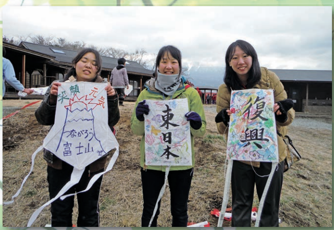
Hope fling with a kite

被災地支援のための物産販売と、防災教育としてDVD「逃げ遅れる人々」を上映しました。参加者数、ボランティア数320名 <横浜市踊場地区センター>