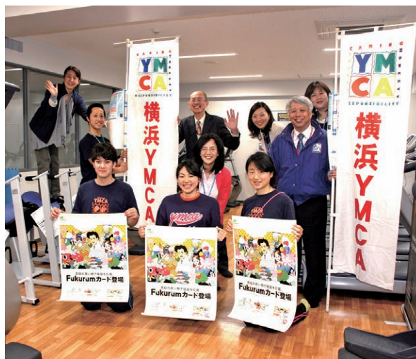
〈Fukurum Card〉 Support for Fukushima

横浜スタジアムで行われた東日本大震災復興応援ゲームで出店された「福島県アンテナショップ」