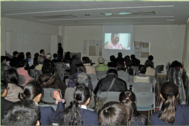
Display of a motion picture about the earthquake

被災地支援のための物産販売と、防災教育としてDVD「逃げ遅れる人々」を上映しました。参加者数、ボランティア数320名 <横浜市踊場地区センター>