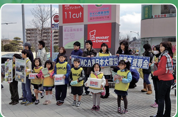
Many children participated in fund raising on the street