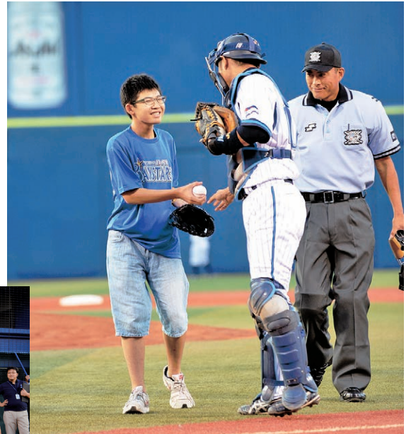
YMCA invited the families of Fukushima to the base ball game

◀ 試合開始前に、避難者の小中学生たちが、各ポジションで選手たちを出迎えました。