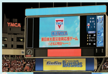
YMCA invited people displaced to Kanagawa to base ball game