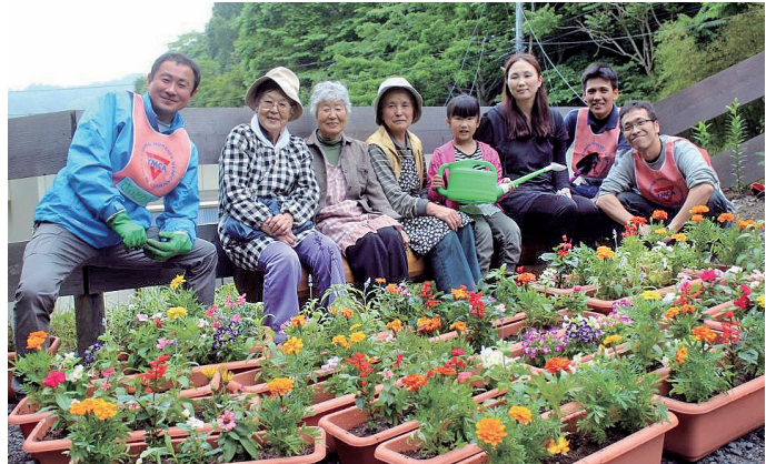
Miyako flower project

また、これ以外にも横浜YMCAではアテナ株式会社と協働して、毎年宮古へ1000球のチューリップの球根を送り続けています。