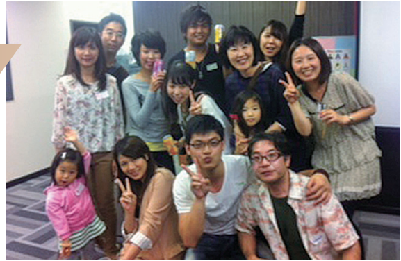
International friendship party in YMCA ACT

YMCA ACTで年2回開催されている国際ナショナルフレンドシップパーティーでは、神奈川に避難されている方々を招待しています。