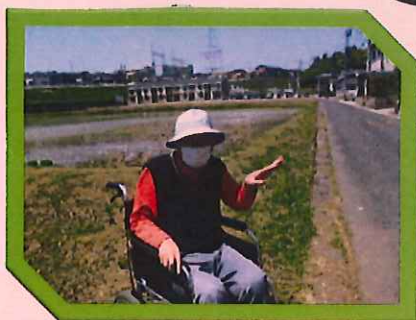
五月晴れの日 近所へお散歩に♪

グループホームは 介護職員処遇改善加算Ⅰ 共用型通所は 介護職員処遇改善加算Ⅰ まとは 看護職員配置加算Ⅰと 介護職員処遇改善加算Ⅰに変更になりました。