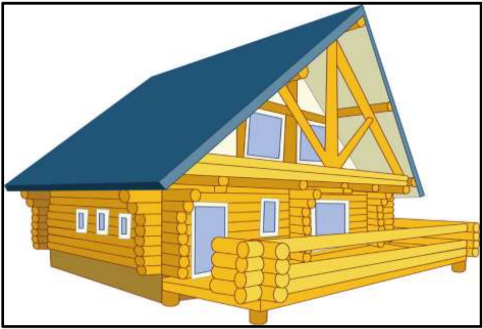
テラスからは比良の山々、開放的なお庭が広がります。クラウドファンディング実施中、建設ボランティアも募集

時はさかのぼること2月中旬、場所は滋賀県高島市にある自治集会所。地域住民にむけた無料のシェア別荘建設計画の説明会の場に理事長は居た。地域ひといきが描く、未来の世界のためには、「自己成長の心」、 【利他の心】 、 【信じる心】 の3つの心が必要と説く。そんな人なら誰もが使える無料のシェア別荘を創りたい。そんな人がゆっくりと静養し、英気を養える場所、おなじ想いを持った人たちがここに来ればつながりあえる場所となることを目指している。