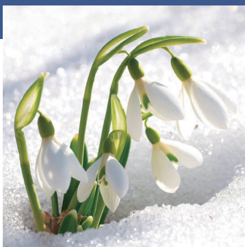
スノードロップ 花言葉：希望