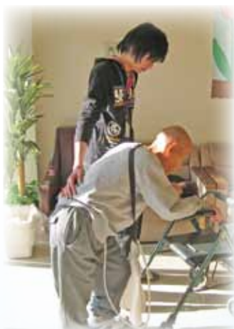
居住支援事業所の支援風景

そして本年度、同プロジェクトで作成した「退行調査用紙」を使用し、「第1回 知的障害者等退行実態調査」を全事業所の利用者を対象に実施しました。