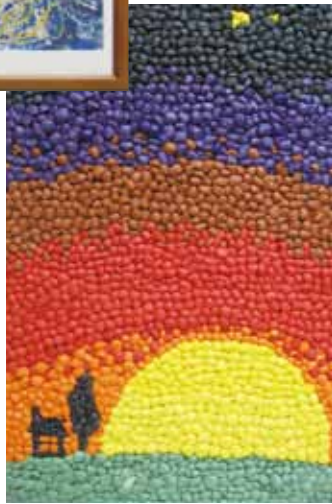
「ゆうやけこやけ」 辰野町地域活動支援センター