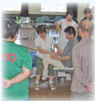
全職員を対象とした身辺介護技術研修