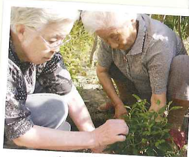
花や野菜づくりに 励んでいます。