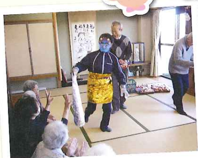
鬼は外、福は内 今年も福が来ますように。