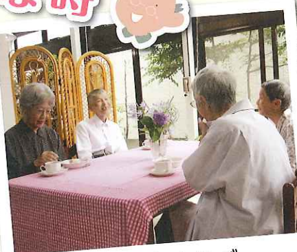
喫茶のケーキとコーヒーで おしゃべりがはずみます。