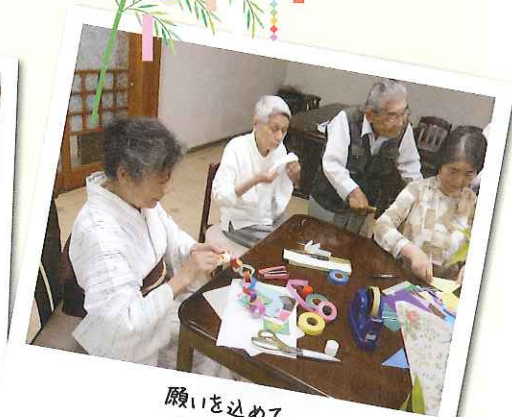
願いを込めて 七夕飾り。