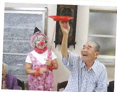
敬老会。 健康と長寿をお祝いして。