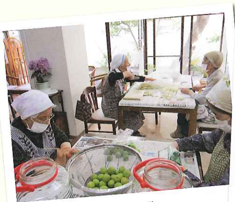
梅酒作りに挑戦の 敬老会に皆でいただきます。