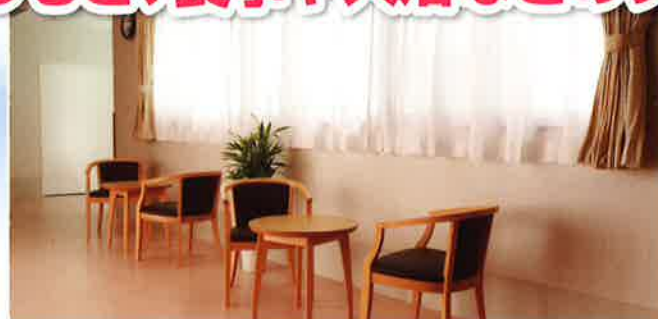
2F～5F セミパブリックスペース