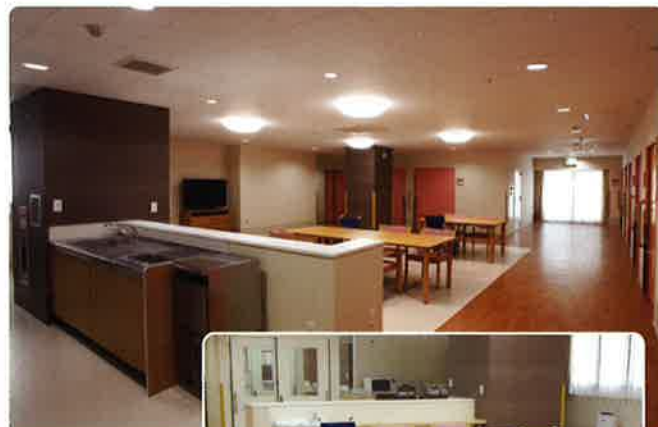
2F 固定式キッチン リビング・ダイニング

「1ユニットを10名のグループ」として1つの生活単位を形成しています。ご入居者・ご利用者個々の尊厳を重視し、その少ない人数で家庭的な雰囲気のもと、食事や入浴などのケアサービスをユニットごとに行います。 ←例) 北三丁目1番地～10番地 10名1グループ