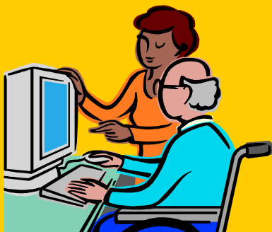
パソコンなどの趣味