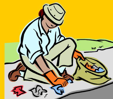
庭の草刈・ゴミ拾い