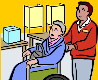
軽い介助の外出サポート