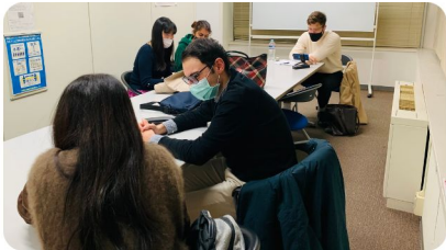
対面クラス / Face to face class