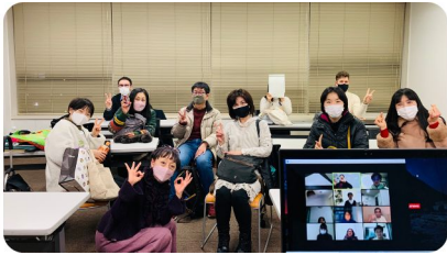
センターでの様子 / at learning center