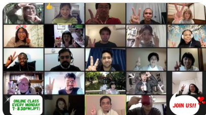
世界中のみんな / From all over the world!