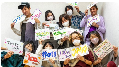
総合フェスタ2022 / NPO festa 2022