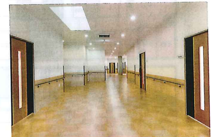
1F エントランスホール