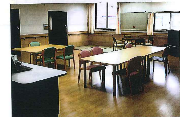
ユニットリビング