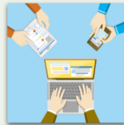
デバイス操作に関する支援