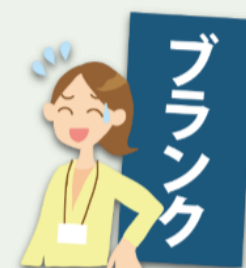
キャリアアップ支援