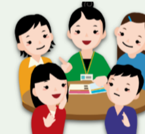
交流・ネットワーク支援