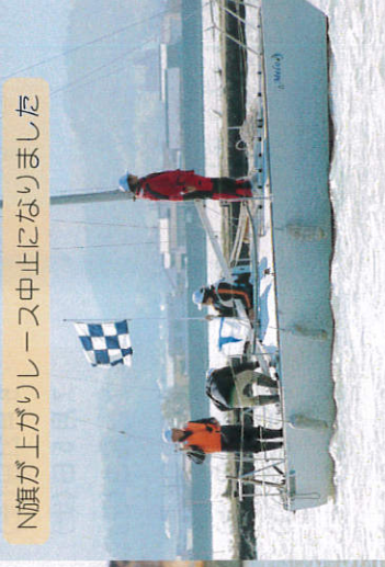
N旗が上がりレース中止になりました