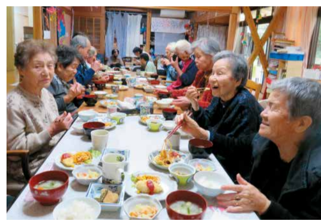
「蓮華はどうか」の問いに、「とっても楽しい」「家より居心地がいい」「毎日でも来たい」といった言葉が次々に返ってきた

その後転職して7年間、福岡の福祉関係のNPO法人でデザイナーズの仕事の責任者として勤務した後、両親の介護のため故郷の鹿児島に帰ってきた。夫婦で共にデザイナーズを始めようと、「NPO法人ふるさと共生福祉会」を設立。蓮華を立ち上げた。目指したのは、「寄り添う介護」。蓮華では、定員14名という規模の小ささを生かし、家庭的な雰囲気の中で、一人ひとりの体調や要望に応じたきめ細やかなケアをスタッフと共にやっている。希望があれば、泊まりや開所日以外の受け入れもしている。