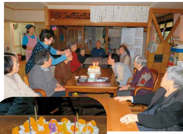
毎月行われる誕生会。94歳を迎えた利用者を祝った。パースデーケーキはこの日みんなで作りました

者が刺激を受け、はりのある生活を送れるよう、手仕事や畑仕事、社会見学など、良いと思ったことはどんどん実行している。