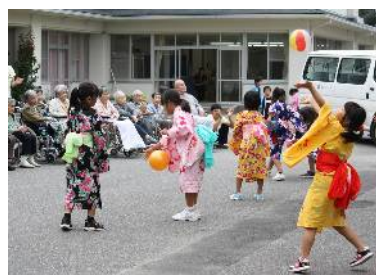
子どもたちとの交流