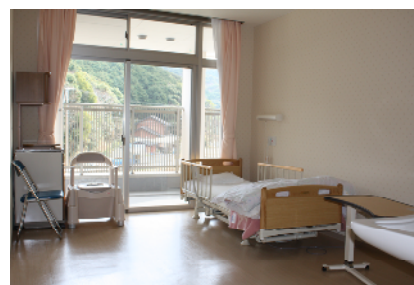
居室(新館:ユニット型個室)