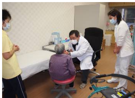
嘱託医師による健康診断

入所されても地域社会との交流が途絶えることはありません。また、施設内の生活がマンネリにならないように、買い物等の外出やお誕生日会、季節の移り変わりに合わせた各種行事（お花見、花火大会、運動会、餅つき、クリスマス会等）を催しています。