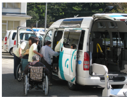
送迎(ご自宅から施設まで)

〔ご利用できる方〕 要支援1・2、要介護度1・2・3・4・5のいずれかに認定された方。