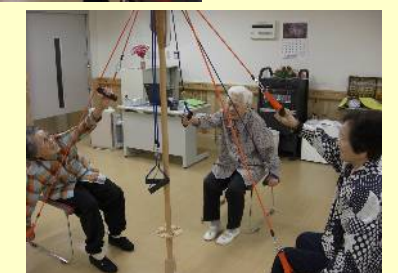
会話をしながら楽しく