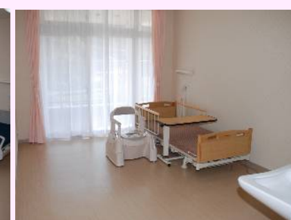
居室（ユニット型個室）