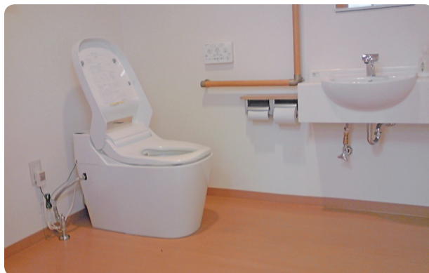
バリアフリースイレ