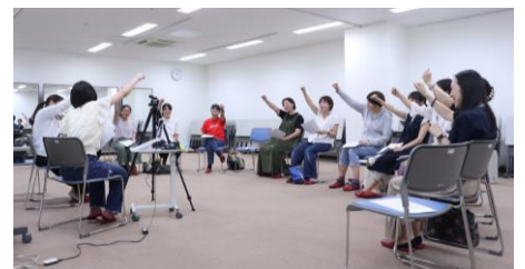
認定ママ講師®フォローアップ研修の様子