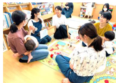
広報誌をつくろう！の様子