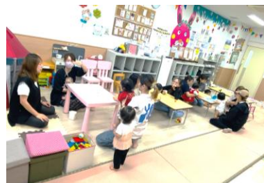
ゆるkomo♪サークルの様子