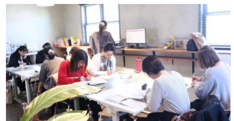
認定ママ講師®フォローアップ研修の様子