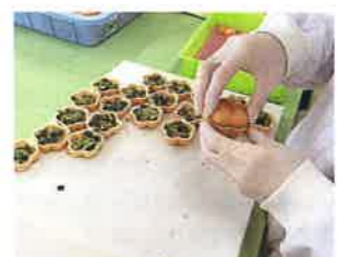
食品の 2 次加工