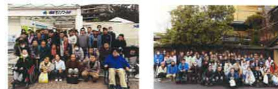
グループ全体で、日帰りレクリエーション