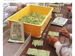
ペットフードの検品、封入