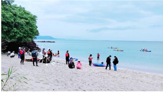
・親子体験アクティビティ（カヤック）