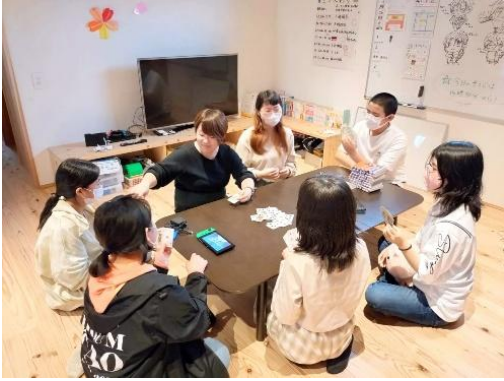
・子どもたちの団らん