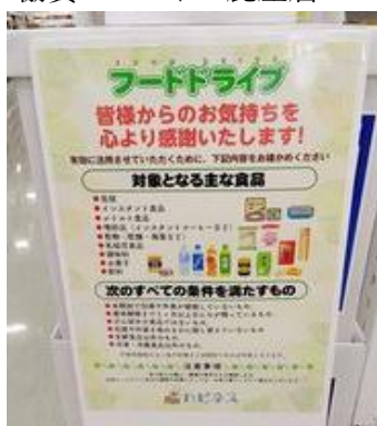
協賛：ハピネス鹿屋店