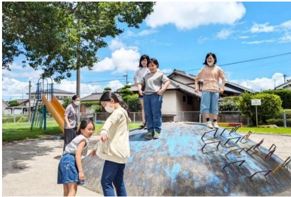
・夏空の下で元気に遊ぶ（居場所前の公園）