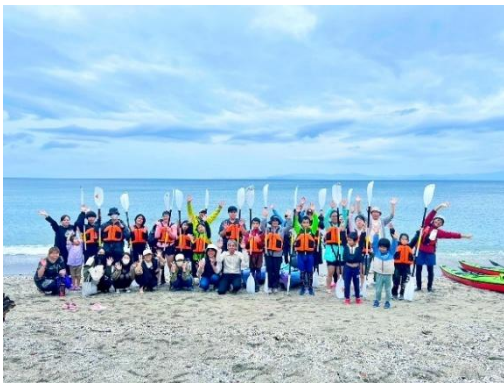
・カヤック教室（親子参加）