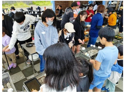
・家族交流（バーベキュー）