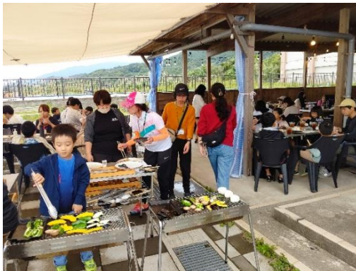
・バーベキュー（親子参加）