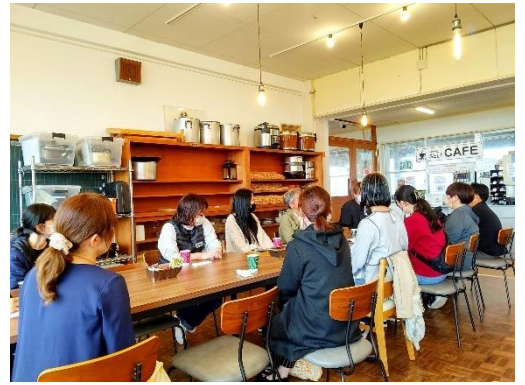
・おやカフェ（親の会）