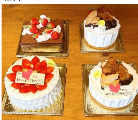
協賛：パティスリールナミエンス