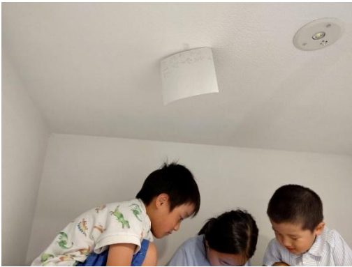
・こどもそうだんしつ（自作）