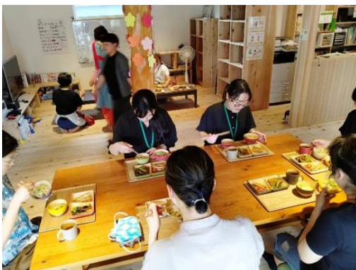
・親の会（ランチ会）