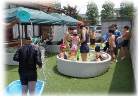
夏休みプール遊び