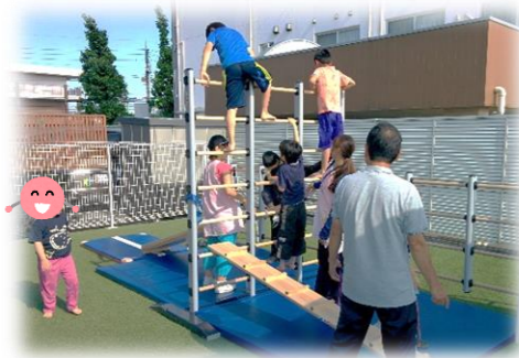
クライミングアイランド