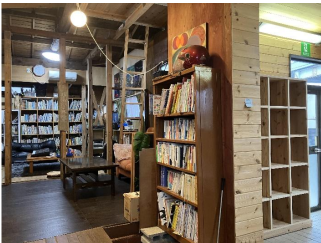
えんがわライブラリーのMY本棚(右)