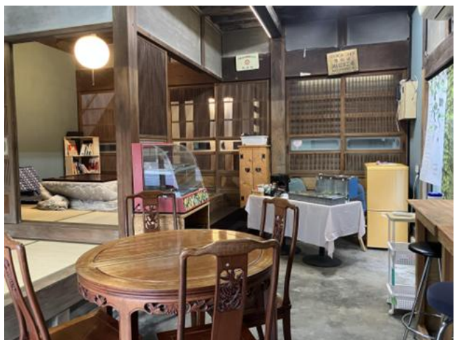
ぽかぽかホームの駄菓子屋コーナー