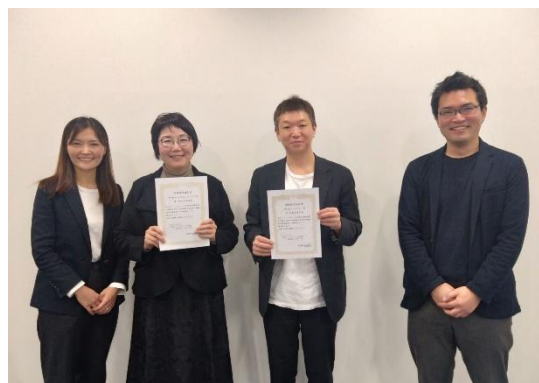
花王ハートポケット倶楽部地域助成の助成決定通知書の贈呈