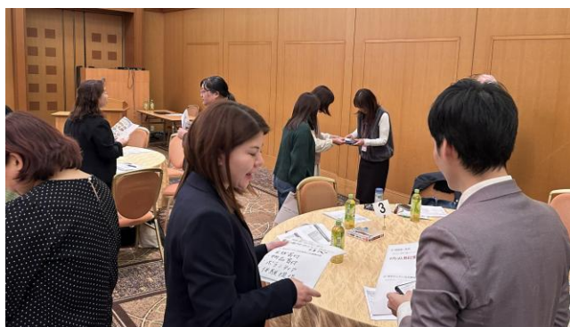
市民活動団体と企業等の連携促進フォーラム