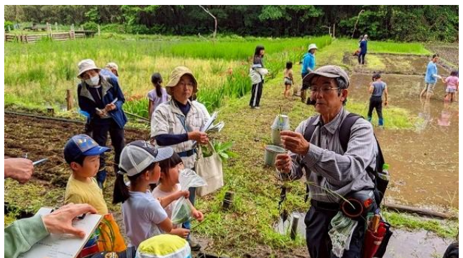
筑西市での SAVE JAPAN プロジェクト