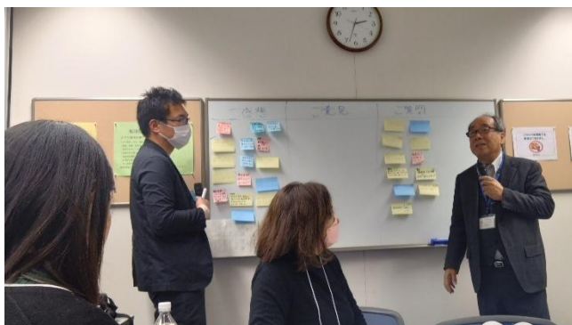
北関東食品ロス活用情報交換会