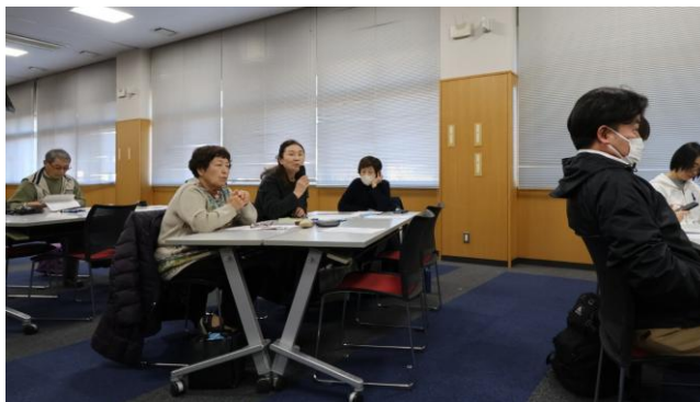
日立市での子ども食堂運営セミナー