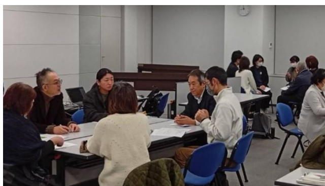
ひきこもり者の居場所づくり研修会