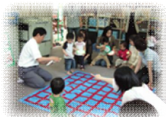
ブルーシートと紙皿で