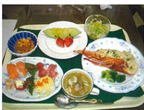
クリスマスディナー