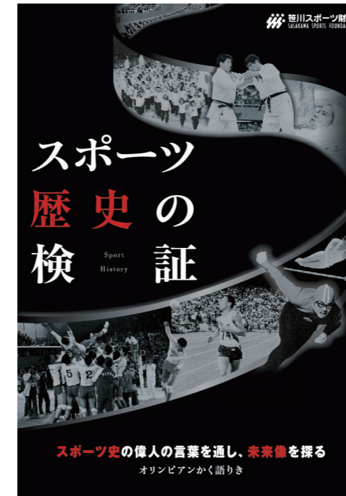
スポーツ歴史の検証 スポーツ史の偉人の言葉を通し、未来像を探る - オリンピアンかく語りき - 発売 (2013)