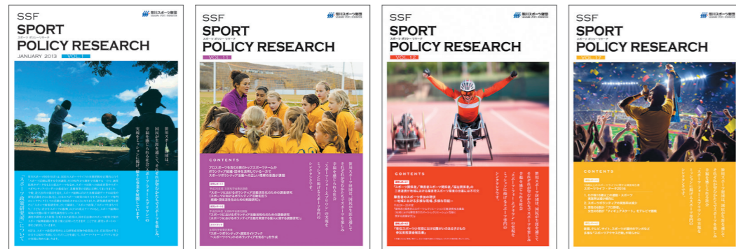
SPORT POLICY RESEARCH 発行 (2012~)