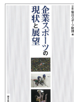
企業スポーツの現状と展望 発売 (2016)