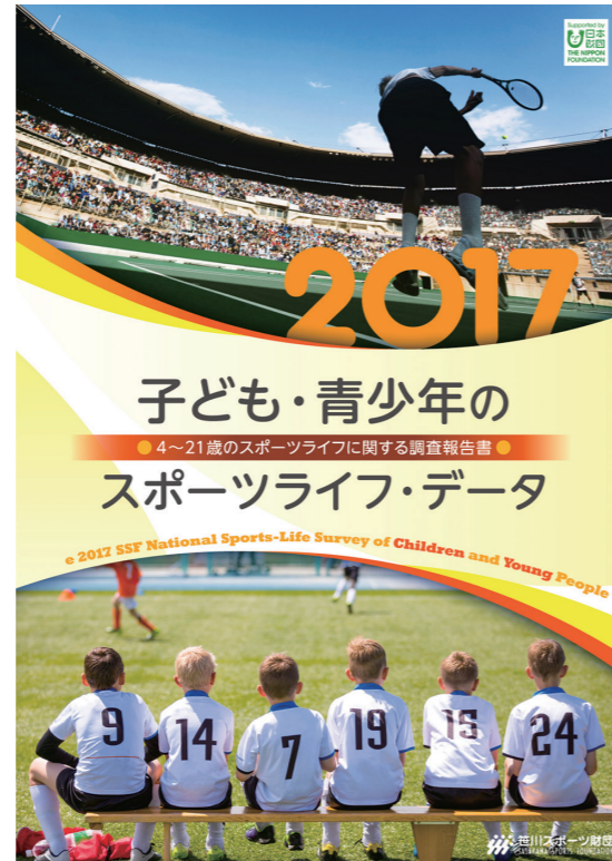
子ども・青少年のスポーツライフ・データ 創刊 (2017)