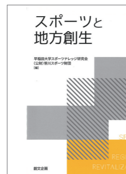
スポーツと地方創生 発売 (2019)