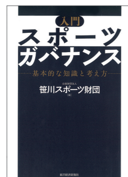
入門 スポーツガバナンス 基本的な知識と考え方 発売 (2014)