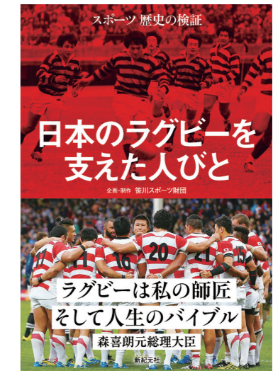
スポーツ歴史の検証 日本のラグビーを支えた人びと 発売 (2019)