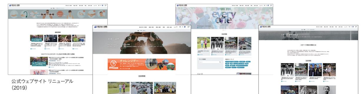
公式ウェブサイト リニューアル (2019)