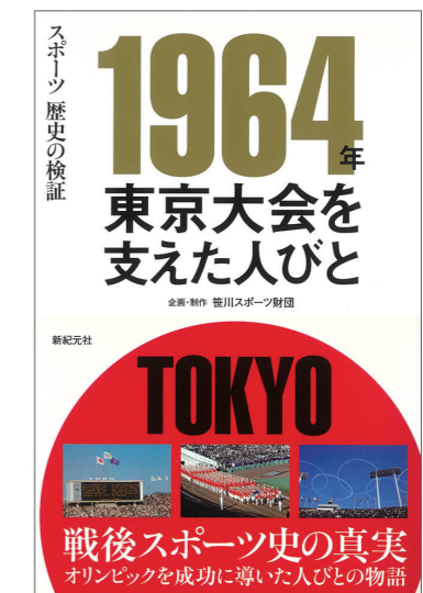
スポーツ歴史の検証 1964年 東京大会を支えた人びと 発売 (2019)