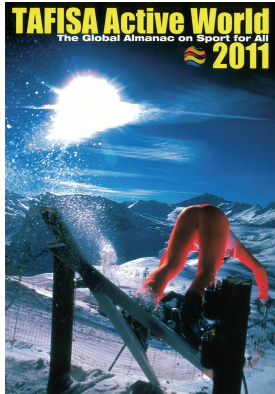
TAFISA Active World 2011 刊行 (2011)