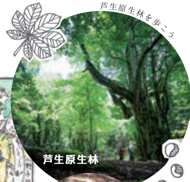
芦生原生林を歩こう