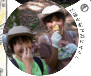
五感を研ぎ澄ませよう