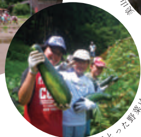
自分たちでとった野菜はおいしい