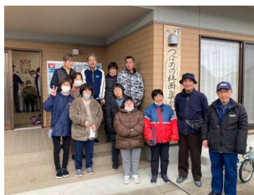
つばめの杜地区の 文化祭での交流