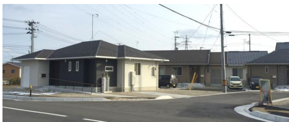
3LDKを2棟お借りし、6名定員のグループホームを 開所する予定

一人暮らしをしているが、 年を取り、これからの一 人暮らしが不安になった り、生活するためには、 いつも見守り・助言が必 要になってきた