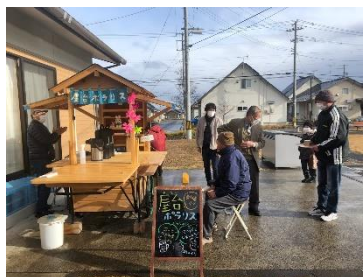
屋台ポラリスで 近所の人と交流