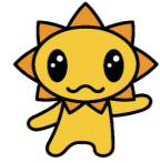
広島県の青少年のマスコット ゆっぴー