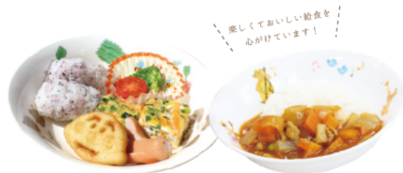
楽しくおいしい給食を心がけています！

園で使う食材は、できるだけ地産地消で安全な食材を使用し、アレルギー除去食や月齢に合わせた離乳食にも対応した、手作りの給食を提供しています。また、食の楽しみや親しみを持ってもらえるような食育活動も毎月取り入れています。