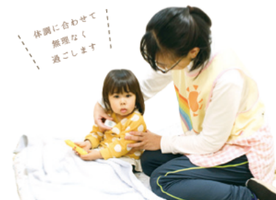
体調に合わせて無理なく過ごします