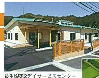
長生園第2デイサービスセンター

在宅で生活されている要介護高齢者に、日帰りで日中をセンターで過ごしていただけます。センターでは食事・入浴などの日常のお世話や、自立のためのリハビリを行います。また他の利用者様とふれあうことによって家庭での閉じこもりや孤独感をなくし、生活の活性化を図ります。