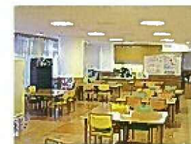
デイサービスセンター長生園