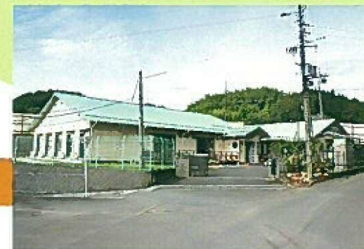
少数の家庭的な雰囲気の中で穏やかに暮らしていただけます。