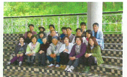
講師派遣、イベントへの出展、研修会、講習会の開催