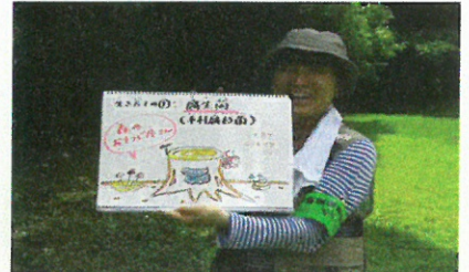
佐賀県内各地での観察会の開催