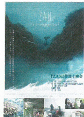
関係書籍の発行や映画上映会の実施