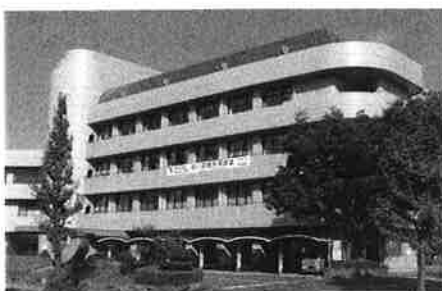
大分県総合社会福祉会館