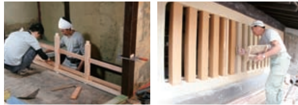
さくじ 作事：家屋などを造ったり修理したりすること。ふしん 普請。建築。（『広辞苑』）