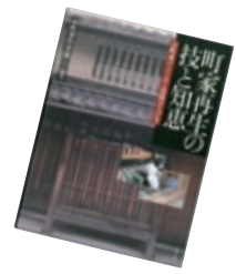
『町家再生の技と知恵』 作事組編 改修のテキスト